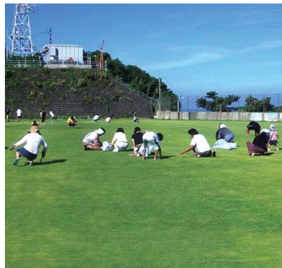
■御蔵島村立御蔵島小学校(東京都御蔵島村) 施工:平成20年1月 面積:3,500m 2 撮影日:平成20年7月 用途:校庭