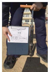
貫入抵抗値測定状況

3 地点の測定結果は 77 ~ 87.52Lb、施工 2 年経過後でも適度な硬さが保たれていました。