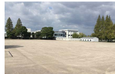
福岡県 福岡教育大学付属久留米中学校 ●施工 / 2018 年 8 月 ●施工面積 / 7,625m 2 (撮影：2018 年 10 月 1 日午前 10 時)

台風通過翌朝の 10 月 1 日午前 10 時、前日夜まで降り続いた大雨の影響が心配される中、現場の状況を確認に行きました。すると、グラウンドには水たまりもなく、すぐに使用できる状態でした。学校関係者様からも、大変ご好評を頂きました。