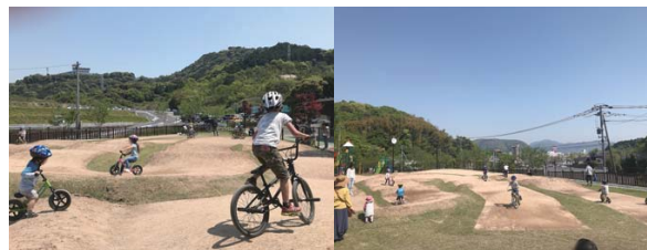
佐賀県武雄市 武雄競輪場公園内ミニ BMX コース ●施工 / 2017 年 12 月 ●施工面積 / 930m 2 (撮影：2018 年 4 月 21 日)

BMX とは Bicycle Motocross (バイシクルモトクロス) の略で、モトクロスに憧れた子供達が自転車と真似たことが始まりです。JGS-CC クレイは、このように起伏に富んだ地形にも利用可能です。大勢の子供たちが、でこぼこ道のコースを、自転車で思い切り楽しんでいます。