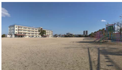
(撮影：2019 年 1 月 16 日)

大在小学校は 2015 年度全国体育研究校最優秀校として、文部科学大臣賞を受賞されています。体育教育に力を入れる小学校を、足元から応援致します。