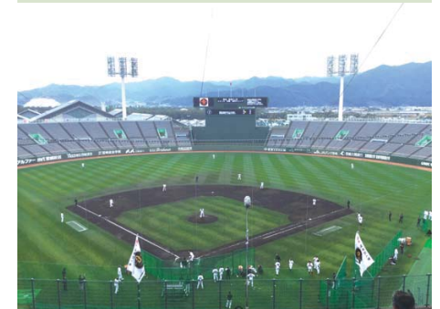
宮崎県宮崎市 KIRISHIMA サンマリスタジアム宮崎 ●施工/2018年6月 ●施工面積/11,011m 2 (撮影:2019年2月7日)