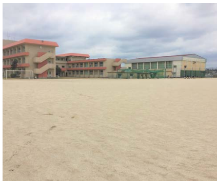
鹿児島県 南さつま市立金峰中学校 ●施工 / 2016 年 3 月 ●施工面積 / 14,163m 2 (撮影：2019 年 1 月 10 日)

「グラウンド改修後に赴任してきたため、改修前との比較はできませんが、他校と比較すると排水性が全く違います。朝方に雨が降ると、その日は校庭が使えないところが多いですが、本校では昼には利用できます。霜柱も立たず、土埃も気になりません。クッション性が良いという声も聴きます。とても快適なグラウンドです。」とご好評を頂きました。