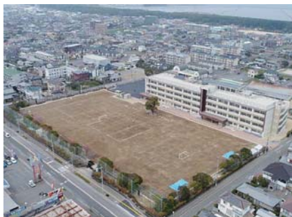
大分県 大分市立大在小学校 ●施工 / 2016 年 12 月 ●施工面積 / 10,700m 2 (撮影：2017 年 2 月)

「海風が強い上に、周囲に住宅も多いので、土埃には気を使いますが、改修前と比較して明らかに違います。苦情もありません。排水性も大変よく、雨後約 2 時間で使えるようになるのは助かります。」とご好評を頂きました。