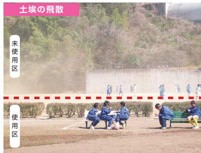
河辺市民球場(東京都青梅市河辺町) 撮影日:平成23年4月 面積:4,010m 2 JGS-CC ® クレイ未使用区(破線上部)は土埃がたっているが、JGS-CC ® クレイ使用区(破線下部)は全くたっていない。